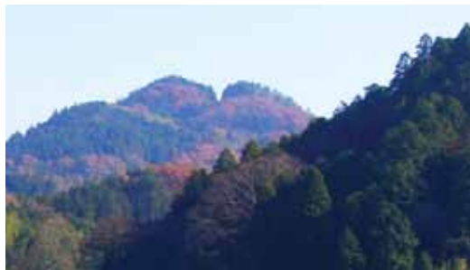
【粟井地区にそびえる能登香の山（双子山）】