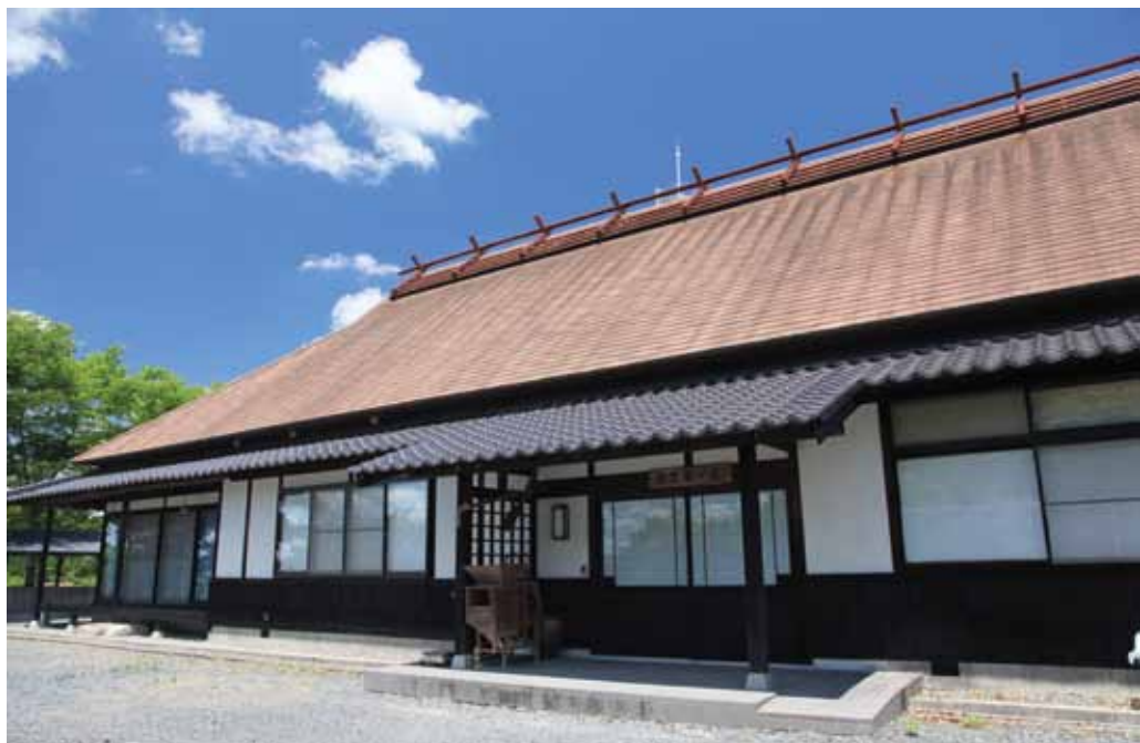
【能登香の家】 宿泊規模：50人 / Wifi 使用可能