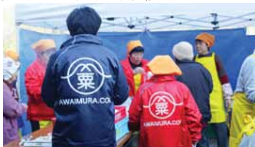
【粟井地区・村創りの会のユニフォームジャケット】