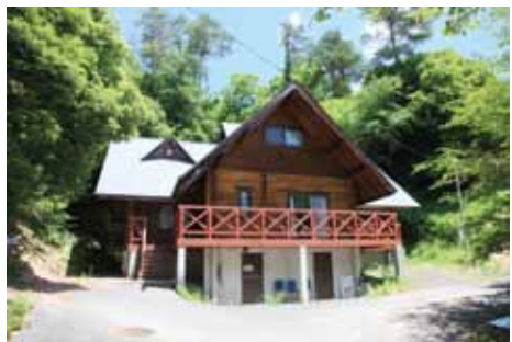
【ログハウスたわだ】 宿泊規模：10人