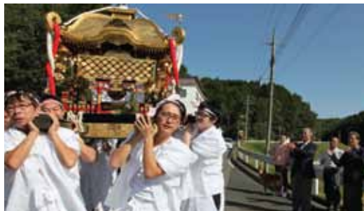
【粟井地区 秋祭りの様子】