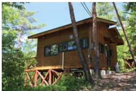
【コテージ 2棟】 宿泊規模：6人 ※1棟当たり